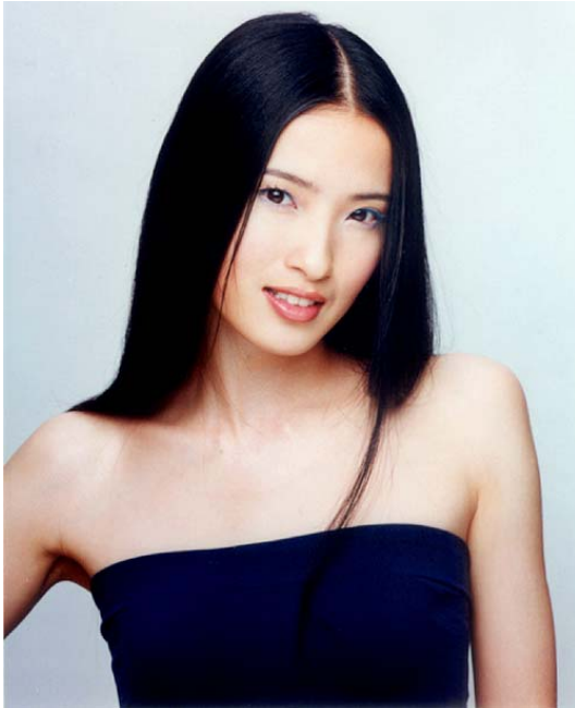
中國影視明星：龔蓓苾